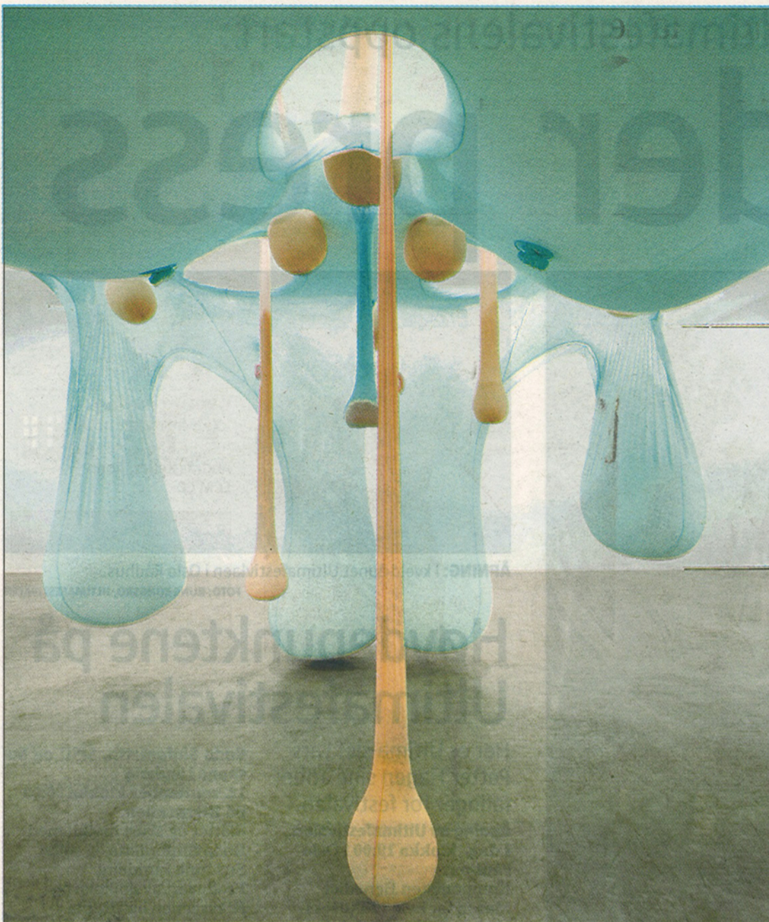
ORGANISK: «Simple and light as a dream...The gravity dont lie. just loves the time» fra 2006.